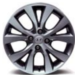
Mâm đúc hợp kim 16"