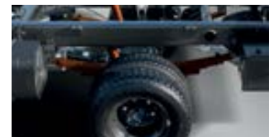
Tải trọng cầu cao và nhíp sau cứng cáp