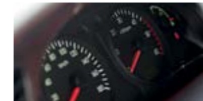
Cụm đồng hồ trung tâm hiển thị rõ ràng, nổi bật