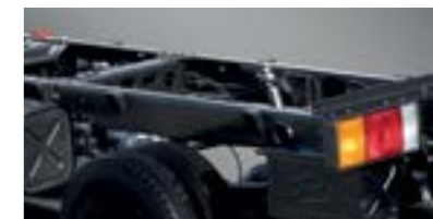
Khung sắt xi gia cường

Thiết kế cabin có thể lật nghiêng giúp cho người ngồi trên cabin không bị ảnh hưởng bởi sức nóng từ động cơ và giảm thiểu độ ồn so với thiết kế cabin thông thường.