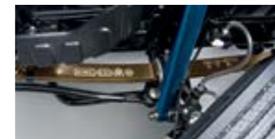
Tăng cường hệ thống treo và giảm chấn trước