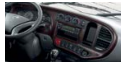
Bảng điều khiển trung tâm hiện đại và dễ thao tác