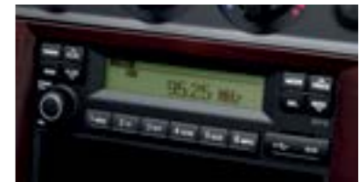
Hệ thống âm thanh đầy đủ kết nối nổi bật