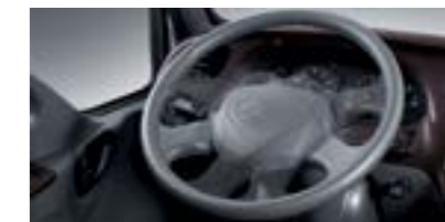
Vô lăng gạt gù và trợ lực